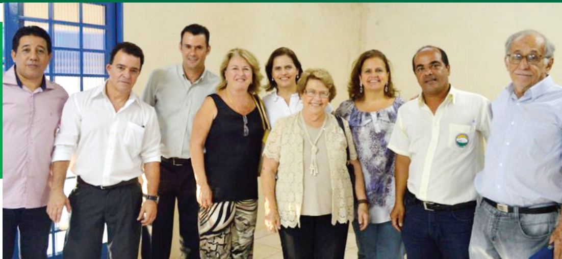
DIRETORES DO SINDICATO E DENTISTAS PRESTIGIAM INAUGURAÇÃO DOS CONSULTÓRIOS ODONTOLÓGICOS