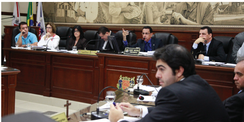
PLENÁRIO DA CÂMARA VOTA PACOTE DE PROJETOS DO EXECUTIVO QUE INSTITUIU O NOVO PLANO DE CARREIRA